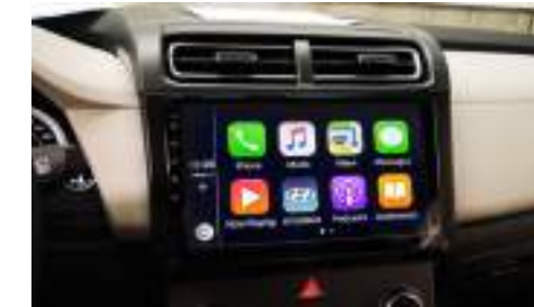
Pantalla táctil de 10" con Apple Car Play y Android Auto