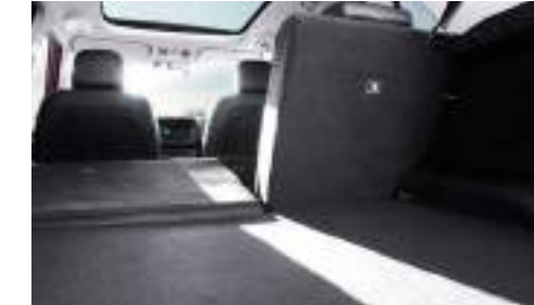
Asiento trasero plegable 60:40