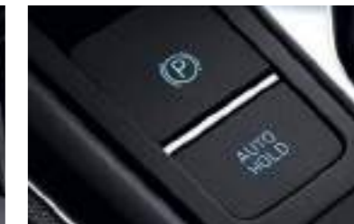
Freno de estacionamiento eléctrico con retención automática