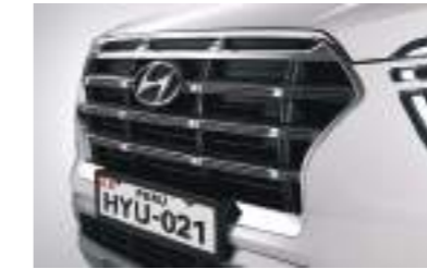
Parrilla en cascada