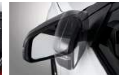
Espejos abatibles electricamente