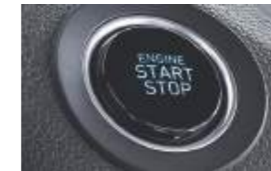
Botón de encendido