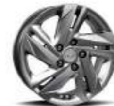
Llantas de aleación de 16"