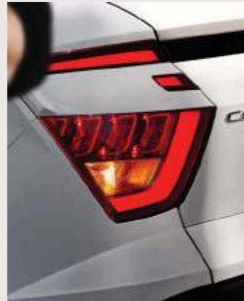
Luces LED traseras combinadas