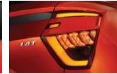
Luces LED traseras combinadas