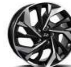
Llantas de aleación de 17" (Tipo C)