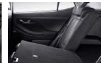
Asientos traseros plegables en 6:4 con reclinable de 2 etapas