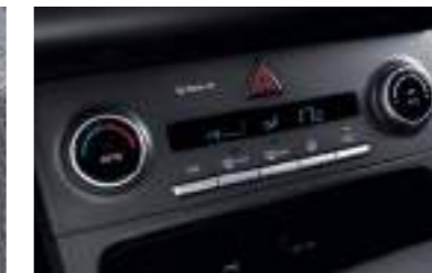
Controles de temperatura totalmente automáticos