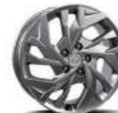
Llantas de aleación de 17"