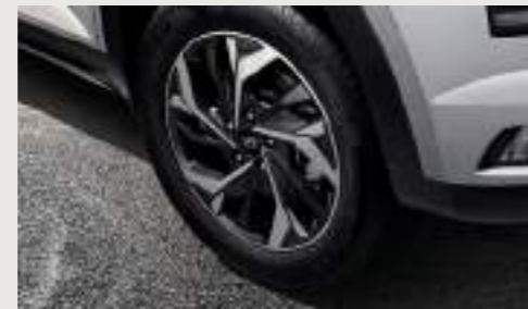
Faros delanteros LED con DRL de LED Llantas de aleación de 17" con corte de diamante