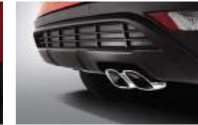
Escape de doble punta (solo Turbo)