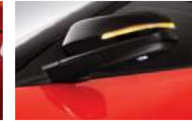
Luces para charcos