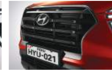
Parilla en cromo oscuro (solo Turbo)