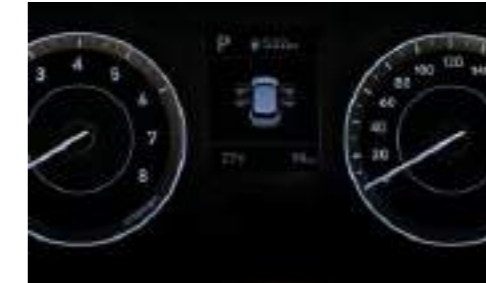
Tablero de instrumentos con pantalla LCD de 3.5"

El panel renovado de instrumentos con pantalla de LCD de 2.5" muestra información detallada con claridad nítida y precisa. La pantalla de audio de 10" viene con soporte para Apple CarPlay™ y Android Auto™ y capacidad de comando de voz. Con el emparejamiento de Bluetooth, refleja la aplicación de navegación de su teléfono inteligente y también le permitirá transmitir audio.