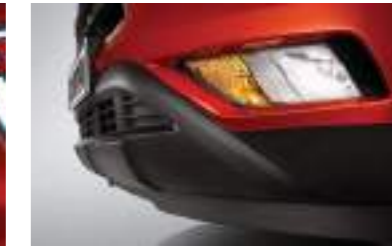
Faros delanteros antiniebla (MFR)