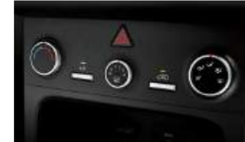
Aire acondicionado manual