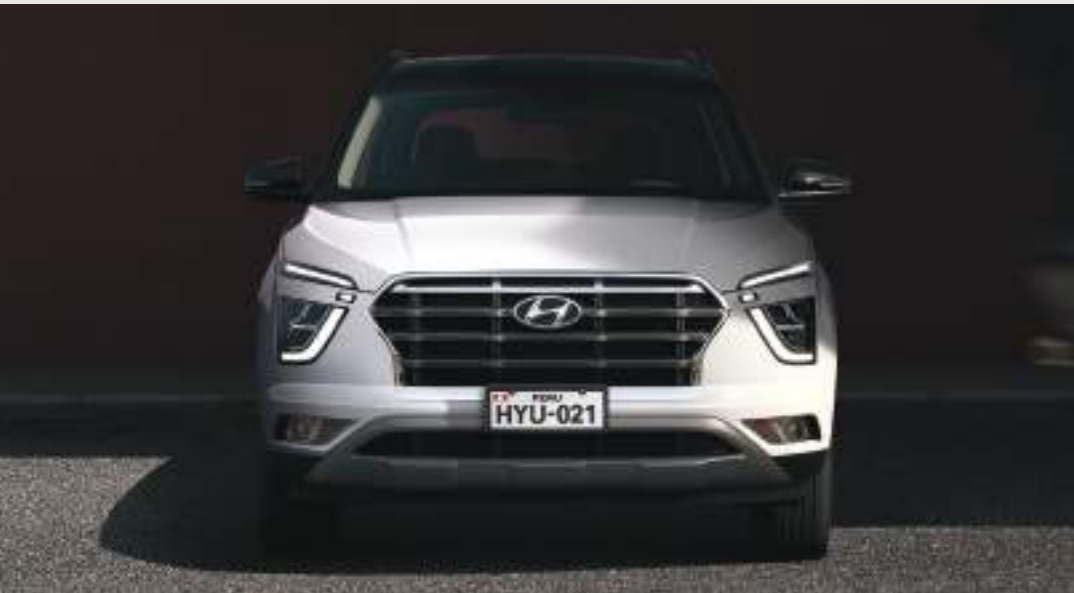
Parte delantera aeroesculpida con distintiva parrilla en cascada

Masculino y moderno con una diferencia: Ese es el estilo del CRETA. Los faros en forma de piedra preciosa del CRETA, su parrilla de gran tamaño y otros detalles llamativos se atreven a ser diferentes y a superar los límites del diseño. Desde todos los ángulos, el CRETA irradia confianza suprema y emoción al manejar, una sensación que se intensifica al presionar el botón de arranque.