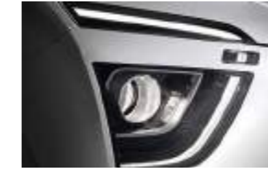
Faros delanteros de proyección halógenos