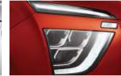
Faros delanteros LED (Tipo MFR) y DRL LED