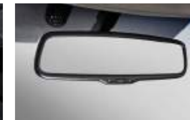
Espejo retrovisor electrocromado

* Las características y especificaciones varían según el mercado. Consulte al distribuidor local.