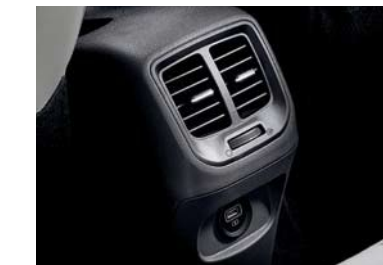
Ventilación de AC en la parte trasera