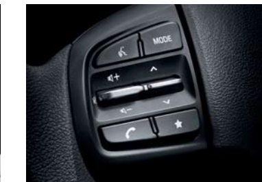
Bluetooth manos libres