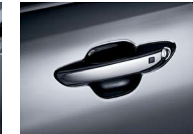
Manijas de puertas cromadas