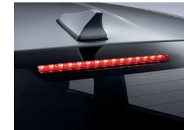
Faro de freno alto (LED)