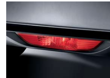
Luz antiniebla trasera