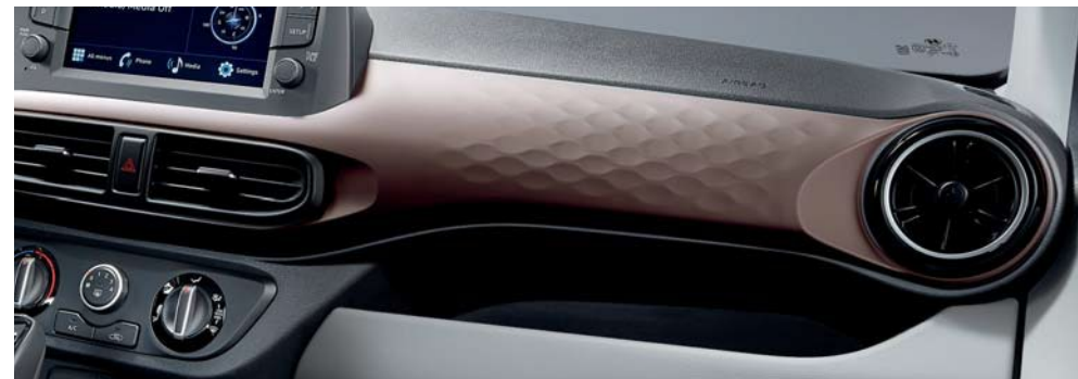
Graige en dos tonos_marrón