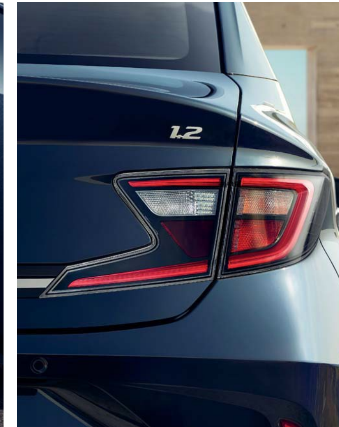
Elegantes faros traseros LED en forma de Z