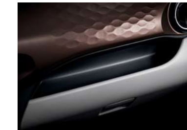
Área de almacenamiento práctica