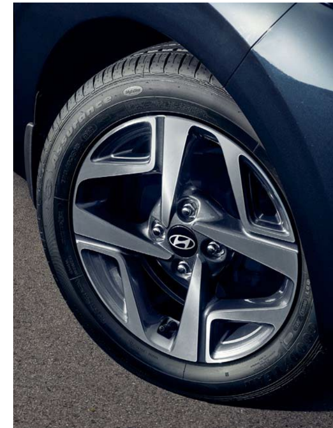
Llantas de aleación de 15" con corte de diamante