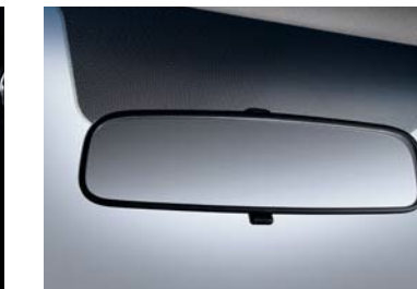
Espejo retrovisor día-noche