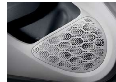
Sistema de cuatro parlantes delanteros/traseros