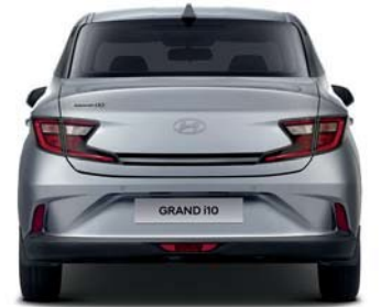
Banda de rodadura* 1,495

Unidad: mm *Rodadura: 14" (delantera y trasera) - 1,489 / 1,507