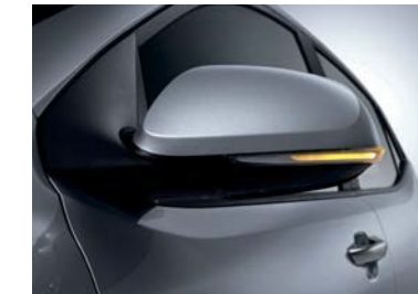
Espejos y repetidores exteriores