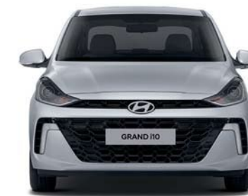
Banda de rodadura* 1,477 Ancho general 1,680