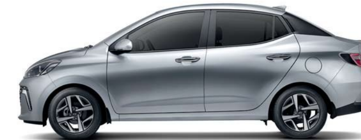
Distancia entre ejes 2,450 Longitud general 3,995