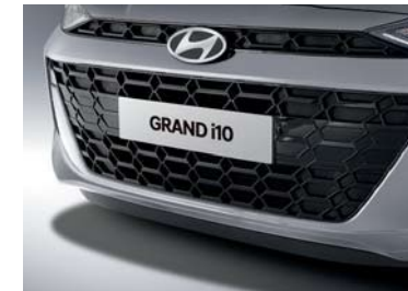
Parrilla del radiador en negro brillante