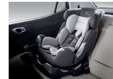
Sistema de anclaje para asientos infantiles ISOFIX