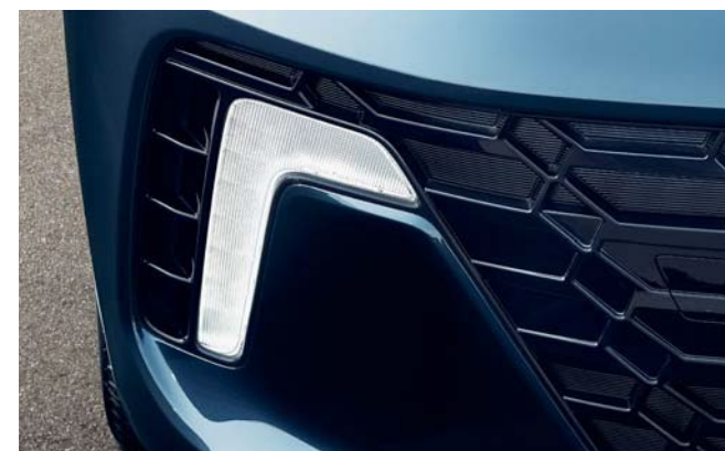
Faros de proyección Luces para circulación diurna (DRL) LED