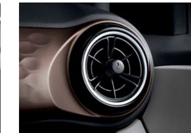
Ventilaciones de AC estilo de hélice única