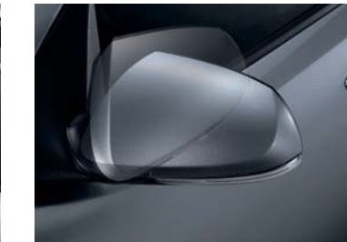
Espejos eléctricos plegables